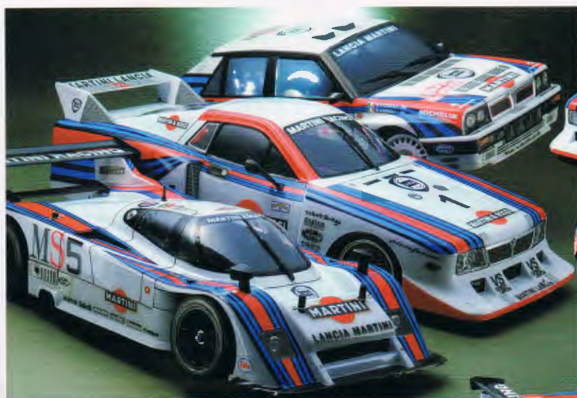
▼ランチアベータ モンテカルロ