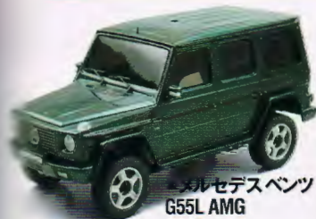
メルセデスベンツ G55L AMG